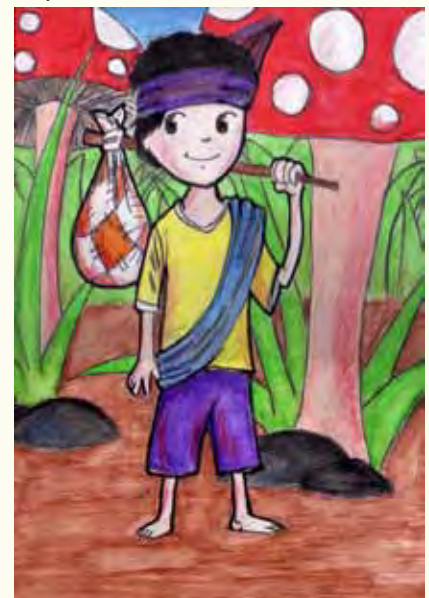
Lukisan-lukisan yang memenangi tiga hadiah utama sempena Peraduan Ilustrasi MBBY