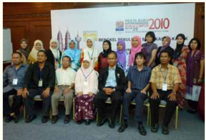
Aktiviti sepanjang Persidangan Buku Kanak-kanak sempena PBAKL 2010